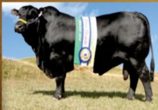
JMT DON MANO 6429 Grande Campeão Nacional da Raça (2010)